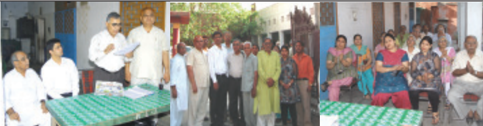
आर्यसमाज झिलमिल कालोनी का निर्वाचन कराते सभा द्वारा नियुक्त निर्वाचन अधिकारी तथा कोर्ट द्वारा नियुक्त पर्यवेक्षक। नव निर्वाचित अधिकारियों के साथ चुनाव अधिकारी एवं सदस्यगण। निर्वाचन में उपस्थित आर्यसमाज झिलमिल कालोनी के घोषित सभासद।

सभा आर्यसमाज झिलमिल कालोनी के नव निर्वाचित पदाधिकारियों को बधाई देती है और आशा करती है कि वहाँ की आर्यसमाज पहले से भी अधिक सक्रिय होकर आर्यसमाज के कार्यों को करेगी और वैदिक धर्म के प्रचार-प्रसार में सहयोग करेगी। आर्यसमाज की सम्पत्तियों का संरक्षण तभी संभव है जब उस समाज के पदाधिकारी मिलजुल कर आर्यसमाज के नियमों एवं उपनियमों के तहत कार्य करेंगे। यदि किसी प्रकार की विघ्न-बाधाएँ आती हैं तो तत्काल संज्ञान लें और दिल्ली आर्य प्रतिनिधि सभा को उसकी सूचना दें ताकि समय रहते उन्हें दूर किया जा सके।